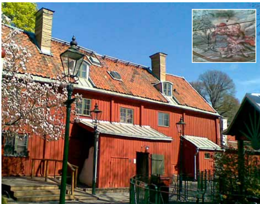
Det blivande Visans Hus är troligen det sista orörda 1700-talshuset i Stockholm. På bilden i nyrestaurerat skick.