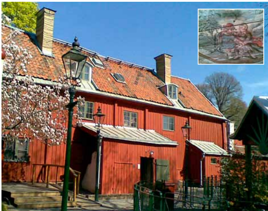
Det blivande Visans Hus är troligen det sista orörda 1700-talshuset i Stockholm. På bilden i nyrestaurerat skick.