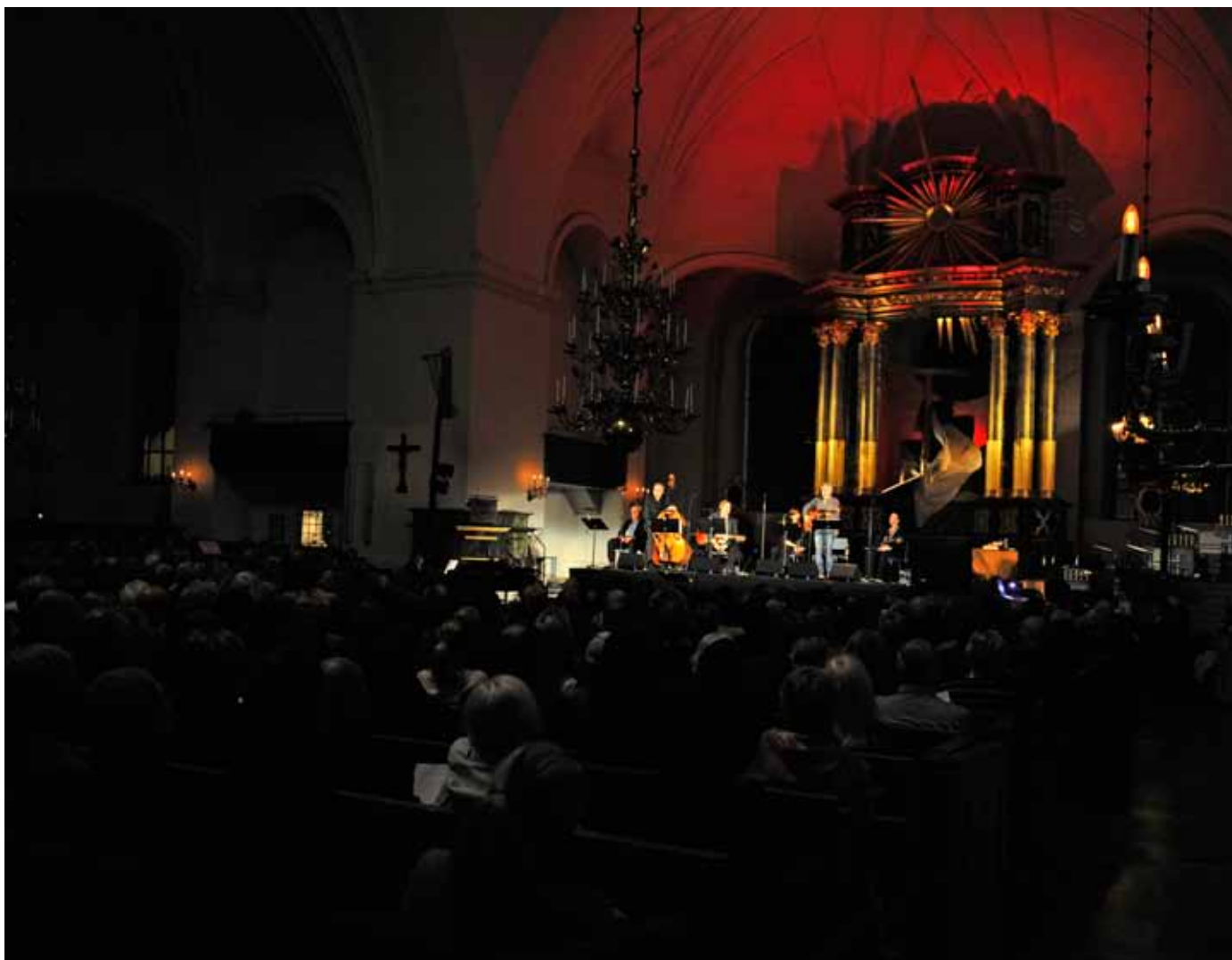
Levande ljus bidrog till stämningen i Katarina kyrka.