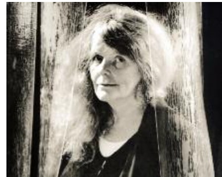
Kristina Lugn.

Timbuktu , Thåström , Nicolai Dunger , Christian Kjellvander och Shanti Roney är några av de medverkande artisterna vid sidan av författarinnan Kristina Lugn och skådespelaren Ingvar Hirdvall som läser