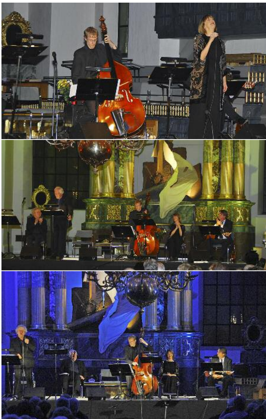
Cornelis' minneskonsert Katarina Kyrka.