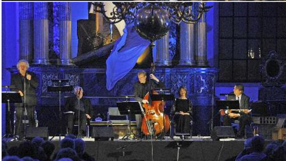
Cornelis' minneskonsert Katarina Kyrka.