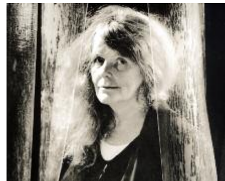
Kristina Lugn.