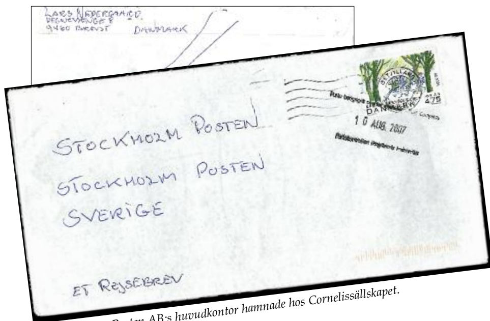
Brevet som via Posten AB:s huvudkontor hamnade hos Cornelissällskapet.