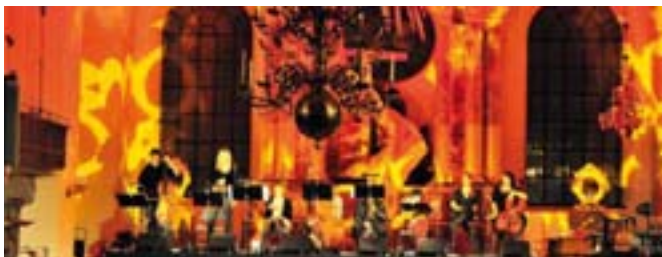
Minneskonserten i Katarina kyrka 2010.

Tack alla – publik, volontärer och artister som kom och gjorde årets upplaga av Cornelisdagen till en formidabel succé! Solen sken som vanligt, det var slutsålt och vi var många som gemensamt hyllade Mäster Cees.