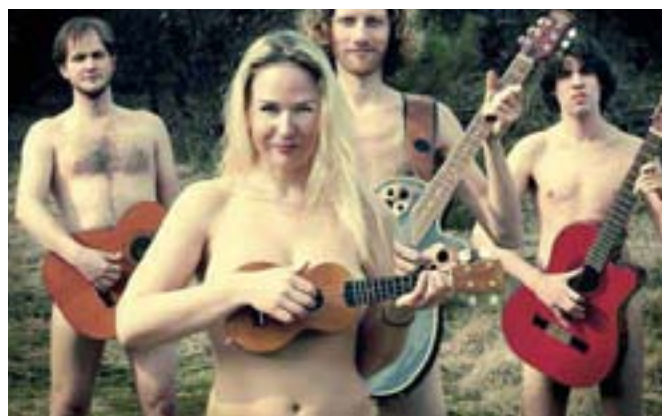
De Andersons spelar Vreeswijk ( www.deandersons.nl/ )