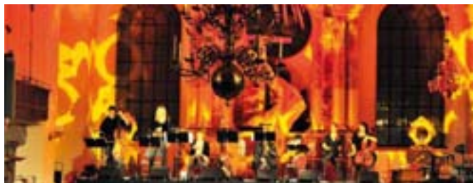
Minneskonserten i Katarina kyrka 2010.

Tack alla – publik, volontärer och artister som kom och gjorde årets upplaga av Cornelisdagen till en formidabel succé! Solen sken som vanligt, det var slutsålt och vi var många som gemensamt hyllade Mäster Cees.